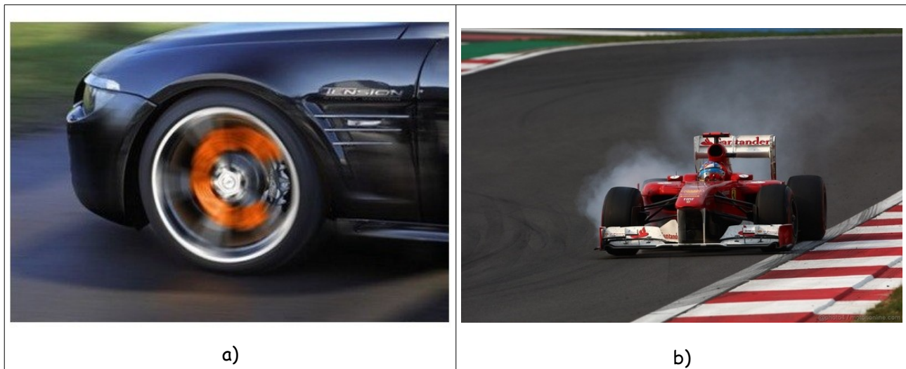
Fig.16.1 Le forze di attrito provocano aumenti di temperatura, Vediamo qui gli effetti di una frenata: a) i dischi si arroventano b) le gomme "fumano"

Per rispondere alle domande precedenti abbiamo un indizio: le forze di attrito provocano un riscaldamento dei corpi sui quali agiscono (► fig.16.1). Questo ci fa supporre che esista un tipo di energia legato alla temperatura a cui si trovano i corpi.